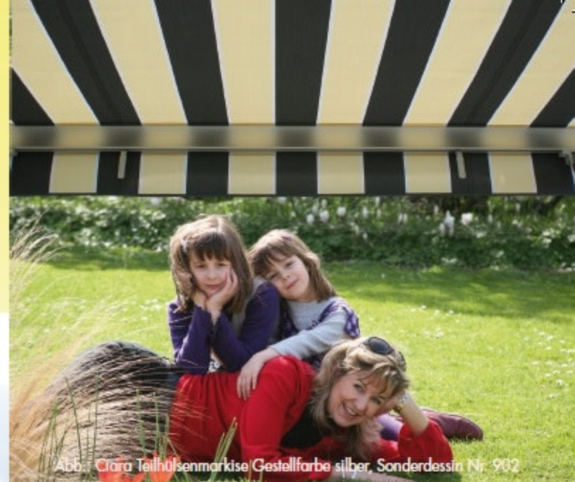
Abb.: Ciara Teilhülsenmarkise Gestellfarbe silber, Sonderdessin Nr. 902

Teilkassette- oder Teilhülsenmarkise, wie immer man sie auch nennen mag. Sie ist eine Gelenkarmmarkise mit einem integrierten Schutzdachprofil. Die ästhetische Form und das elegante Styling bietet neben der Optik einen optimalen Schutz gegen Wind und Wetter. Das nach unten hin offene Hülsenprofil gewährleistet eine gute Luftzirkulation für das Tuch. Beim Einfahren der Markise können grobe Verschmutzungen nach unten herausfallen.