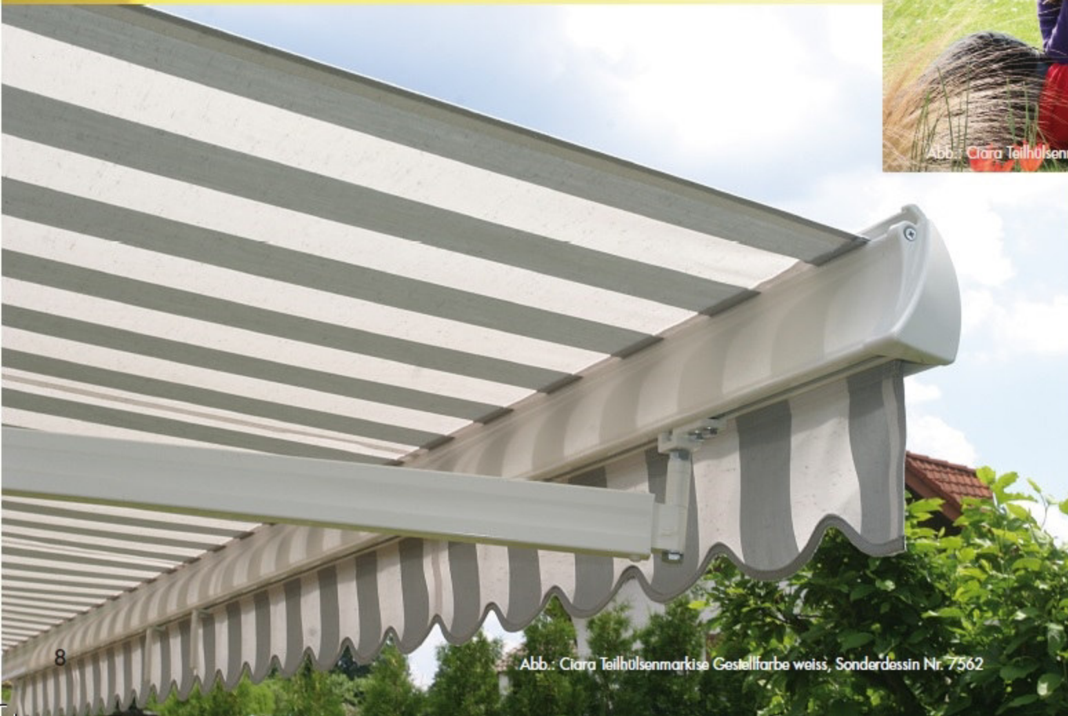
Abb.: Ciara Teilhülsenmarkise Gestellfarbe weiss, Sonderdessin Nr. 7562