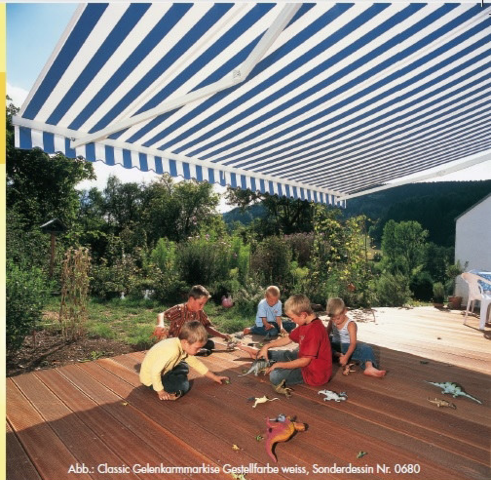
Abb.: Classic Gelenkarmmarkise Gestellfarbe weiss, Sonderdessin Nr. 0680

Zubehör nur bei der Gelenkarmmarkise Classic möglich.